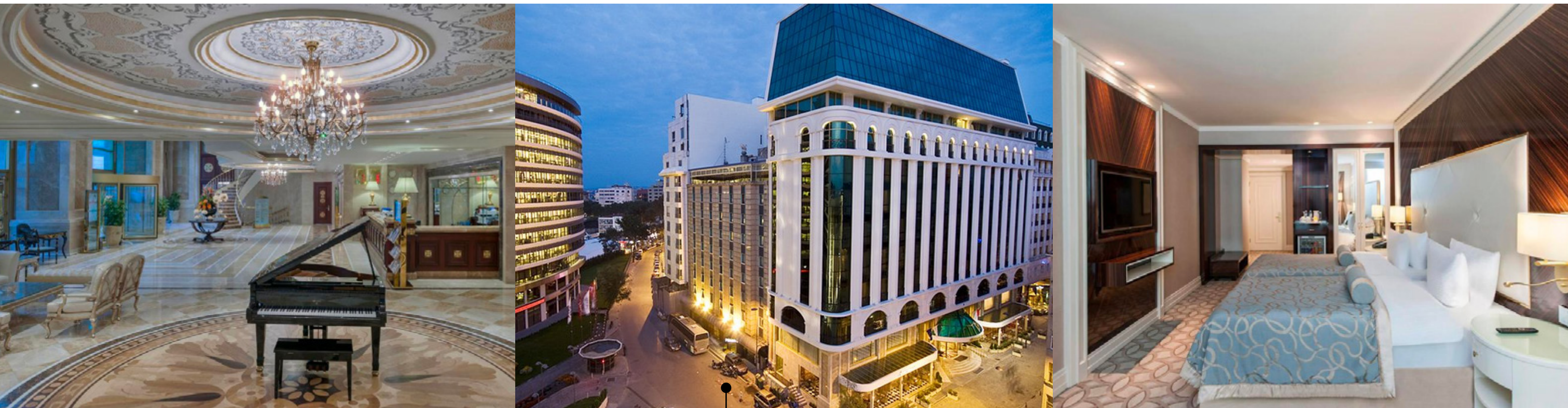
HOTEL ★★★★★ (O CATEGORÍA SIMILAR): ELITE WORLD İSTANBUL TAKSIM

Día 4 ESTAMBUL Desayuno. Por la mañana, realizarán un recorrido panorámico con guía privado por el casco antiguo de la ciudad. Pasarán por el Acueducto Romano, construido en el año 368, y continuare- mos hacia las Murallas de Constantinopla, que inspiraron el nombre de la ciudad: "Estambul". Luego cruzarán el Puente de Gálata sobre el Cuerno de Oro, donde disfrutarán de una vista panorámica dominada por mezquitas, la Torre de Gálata y la parte asiática de la ciudad. Por la tarde, tendrán la oportunidad de visitar el Bazar de las Especies y la Mezquita de Suleimán. Re- greso al hotel. Alojamiento.