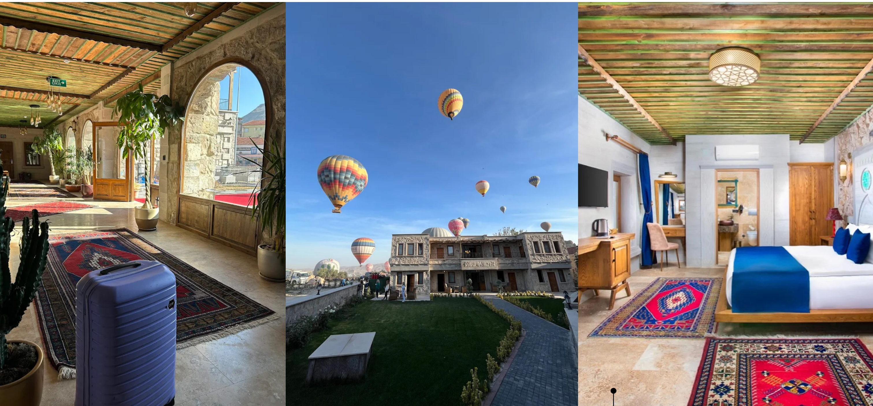
EXCLUSIVO HOTEL CUEVA ★★★★★ (O CATEGORÍA SIMILAR): RAPSODI CAPADOCIA

Desayuno. Salida temprano hacia Ankara para visitar la capital de Turquía y el Mausoleo del fundador de la República Atatürk. Salida hacia Capadocia. Durante el trayecto, haremos una parada para contemplar el Lago Salado, un lugar espectacular ideal para tomar fotografías. Luego, visitaremos un Caravanserai, un hospedaje de la época de la Ruta de la Seda. Llegada a Capadocia, cena y alojamiento.